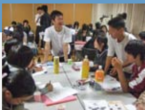
↑自分達が出来ることを話し合う

UnitedChildren（以下UC）は、2001年、静岡県浜松市の4人の中学生が立ち上げた団体です。まちづくりイベントの企画、清掃活動など、地域社会の為に自分たちが出来ることを考え、企画・実行・振り返りのすべてを中高生を中心としたメンバー自身の手で行っています。そしてその活動で地域に貢献すると共に、自らも素晴らしい未来を創り出せる人間に成長することを目的としています。