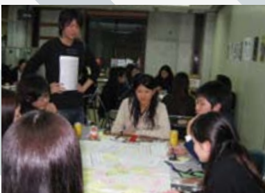
↑OBの大学生によるワークショップ