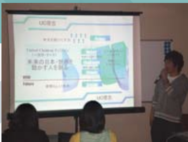
↑プレゼンテーションに挑むメンバー